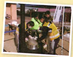
かまどストーブによる豚汁の炊出し