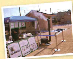
バイオコークス 啓発PRブース

「今回の防災訓練で使用したストーブやバイオコークスがあれば、お湯を沸かして備蓄食料を調理したり、日用品を消毒したりできるほか、暖を取ることもできます。バイオコークスを備蓄品に加えることによって、避難開始直後から自力で対応できるので、とても有効だと思います。」