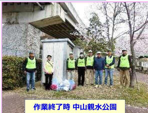
作業終了時 中山親水公園