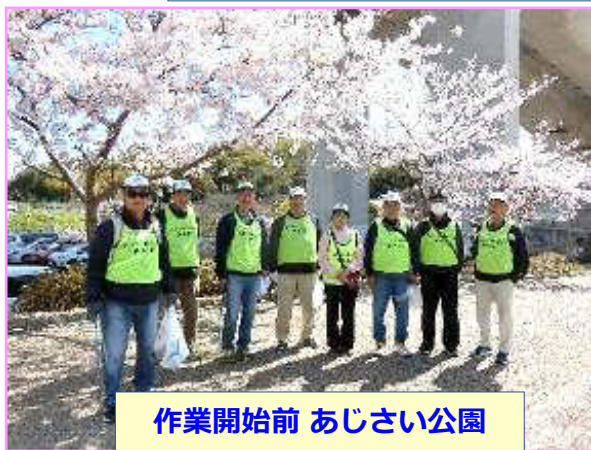
作業開始前 あじさい公園