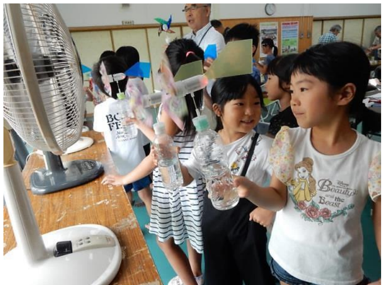
赤い LED ランプが点いたよ！！