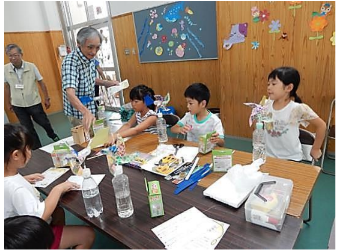
完成した「風力発電機」のプロペラを扇風機で回して LED ランプの点灯確認を何度もして楽しみました。