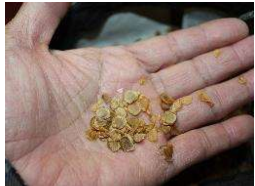
今年はウバユリも咲いたのでその種も採種