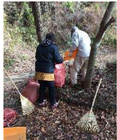
駐車場奥の彼は置き場の整理