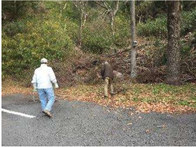
林内に残る小枝を集めてチップ掛け作業