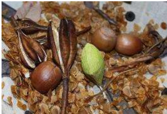
今年採種したササユリの種