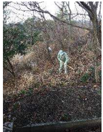
チェーンソーや長柄鎌によるネザサ刈り取り作業